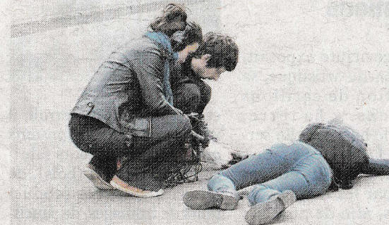
■ La deuxième scène représentait une jeune fille mourant sur la route.